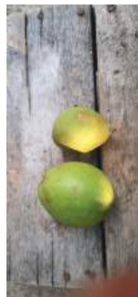
بعد از تیمار داگونیس علیه بیماری سفیدک سطحی