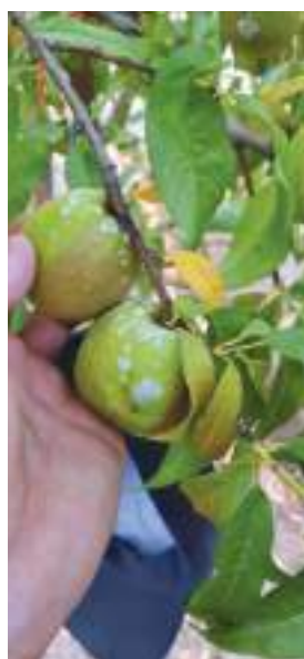
تصویر قبل از تیمار داگونیس علیه بیماری سفیدک